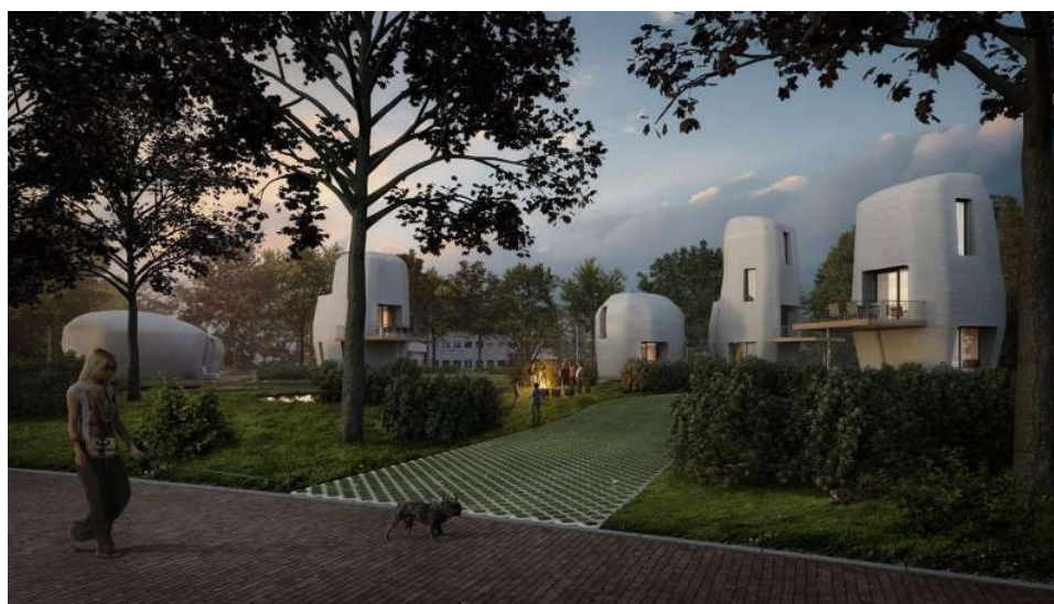
Cinq maisons imprimées en 3D seront disponibles à la vente dès 2019. La première a reçu plus de 20 candidatures en une semaine.